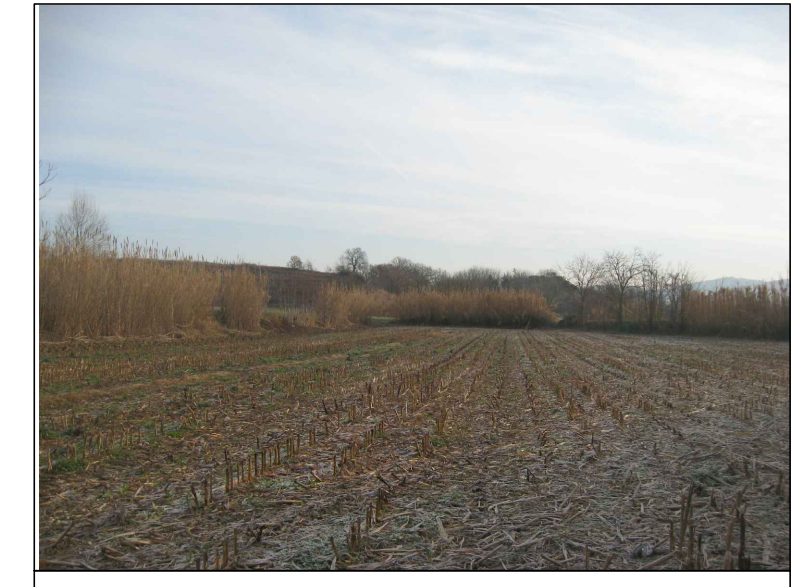
Cono visivo I