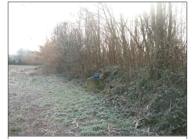
Cono visivo G