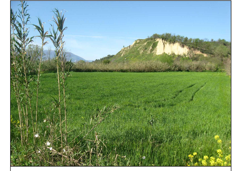
Cono visivo F