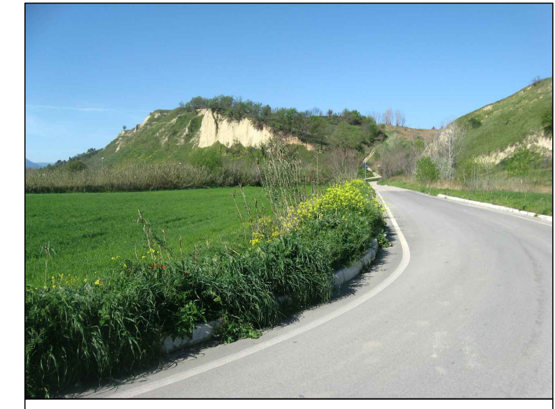
Cono visivo E