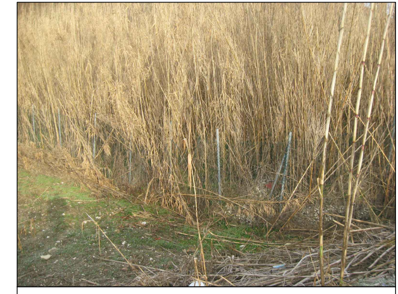
Cono visivo H