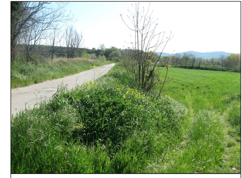
Cono visivo B