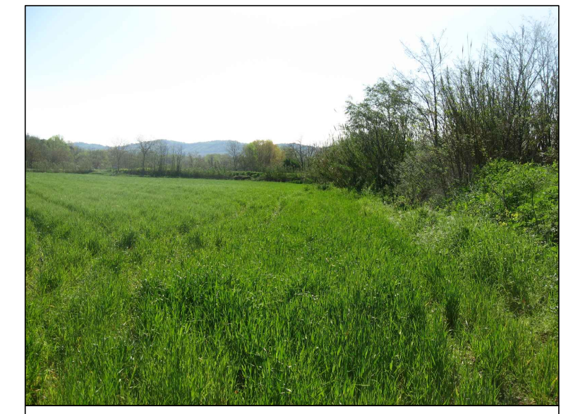
Cono visivo D