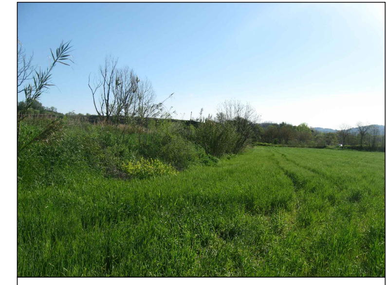
Cono visivo C