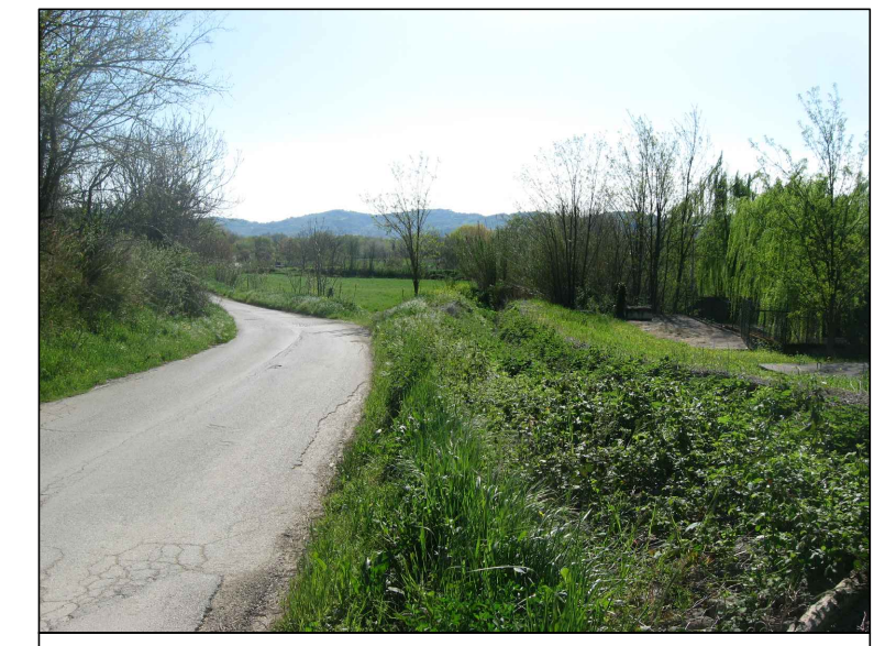
Cono visivo A